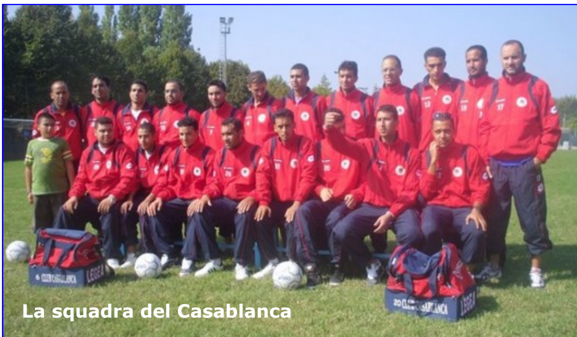
La squadra del Casablanca