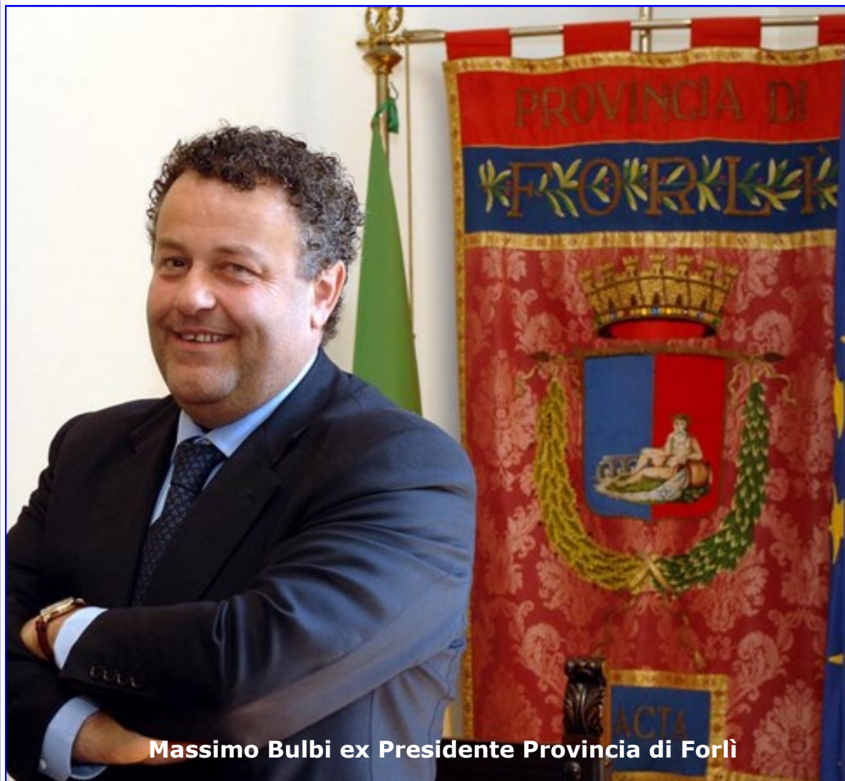
Massimo Bulbi ex Presidente Provincia di Forlì

Come non partecipammo nel 2009, invitando i cittadini a non ritirare la scheda, a maggior ragione non parteciperemo oggi che siamo dentro le istituzioni, ne come candidati ne come elettori!