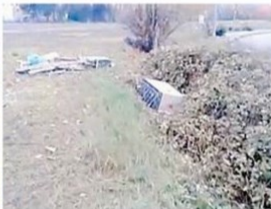
Discarica Sacchetti e rifiuti ingombranti nell'area di fronte al centro commerciale destinata ai circhi e alle attrazioni itineranti

Discarica di rifiuti nell'area destinata ai circhi a ridosso del centro commerciale Punta di Ferro. La quantità