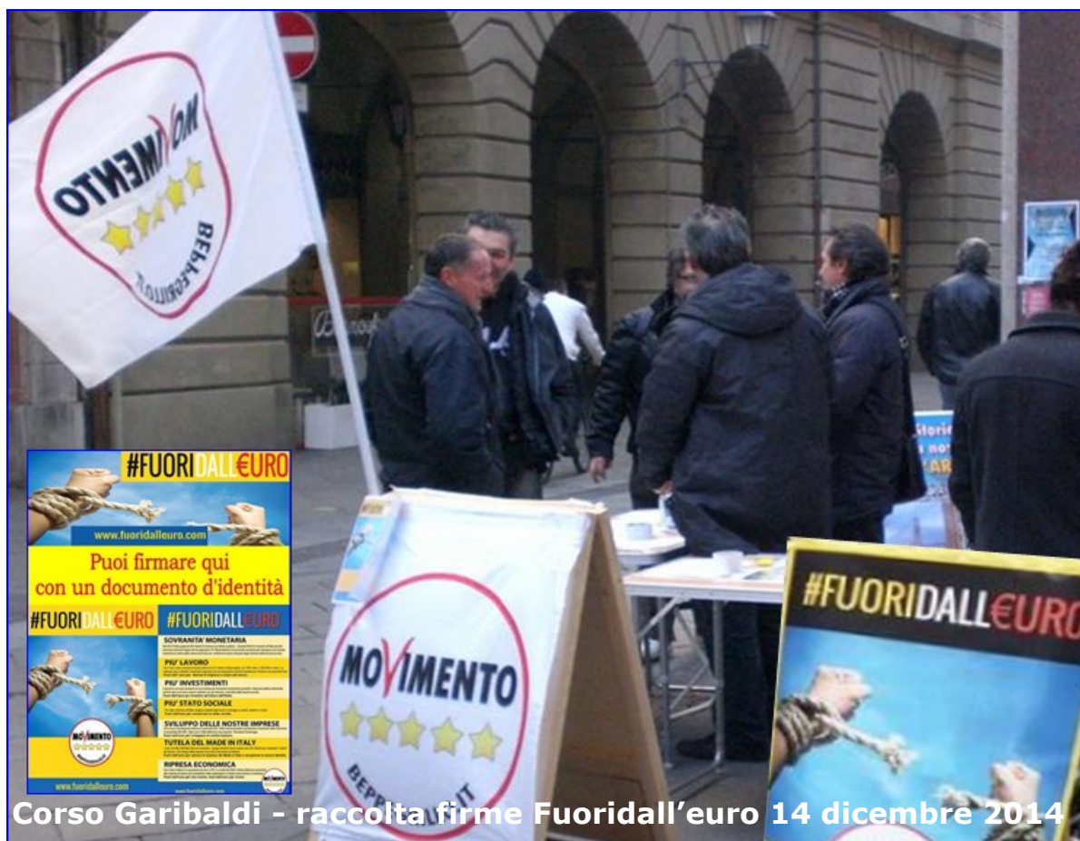
Corso Garibaldi - raccolta firme Fuoridall'euro 14 dicembre 2014

Una volta depositata, presumibilmente a maggio 2015, i portavoce del M5S alla Camera e al Senato si faranno carico di presentarla in Parlamento per la discussione in Aula.