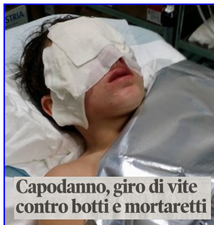
Capodanno, giro di vite contro botti e mortaretti